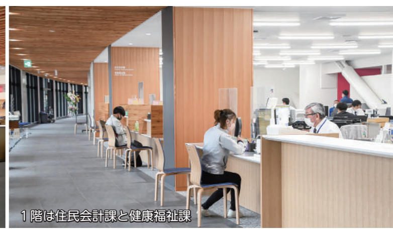
1階は住民会計課と健康福祉課