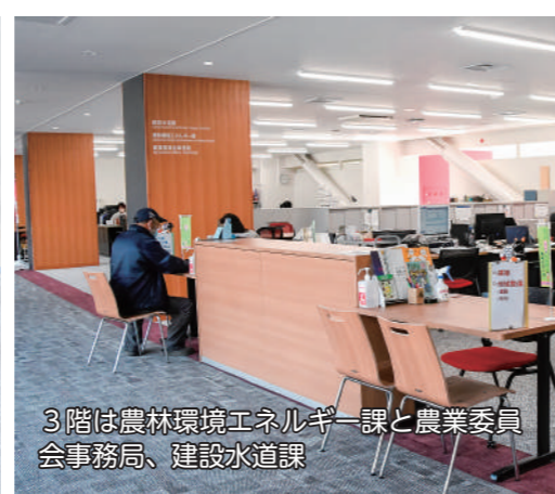
3階は農林環境エネルギー課と農業委員会事務局、建設水道課