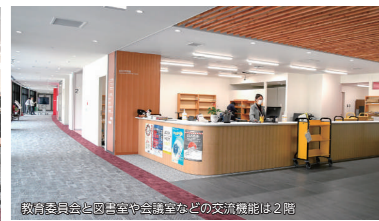
教育委員会と図書室や会議室などの交流機能は2階