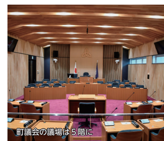
町議会の議場は5階に