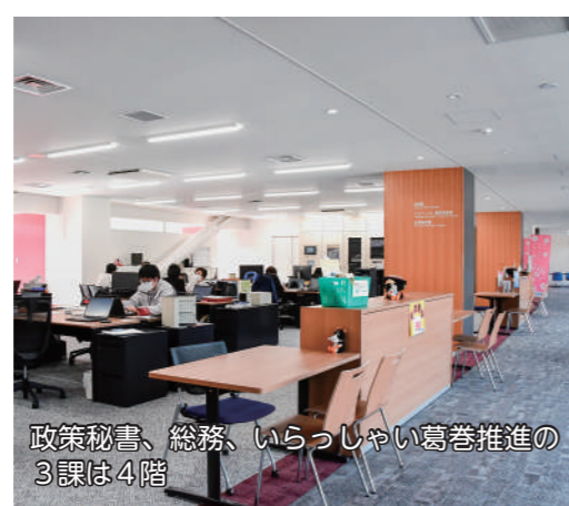
政策秘書、総務、いらっしやい葛巻推進の3課は4階