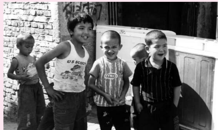
トルファンの子どもたち。顔立ちは西アジアに近い

トルファンの農産物の生産量はブドウが最も多く、次いで綿花、ハミウリという果物です。日本のスイカやメロンのような果物もたくさん栽培されていま