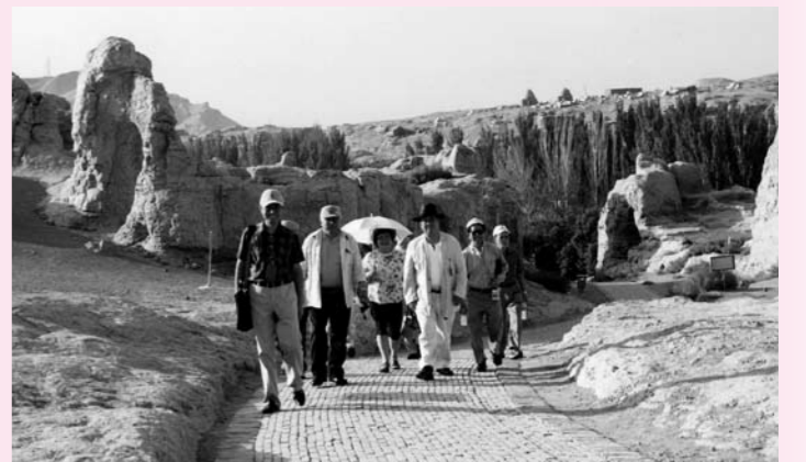
砂漠地帯トルファンの気温は40℃を超えます

カザフ族、モンゴル族など42の民族からなる多民族地域です。シルクロードの玄関とも呼ばれており、中国とは言え、ロシアやモンゴル、また西アジア諸国の文化や習慣の影響を強く受けている地域です。街にはモスク（イスラム教の寺院）も見られ、店の看板も中国語とアラビア語でかかれており、道ゆく人にはイスラム系の服装も見られました。