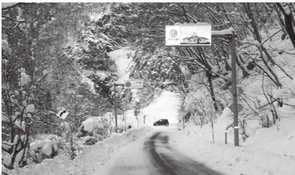
道幅が狭くすれ違いが危険な主要地方道一戸・葛巻線(町境から一戸方面を撮影)