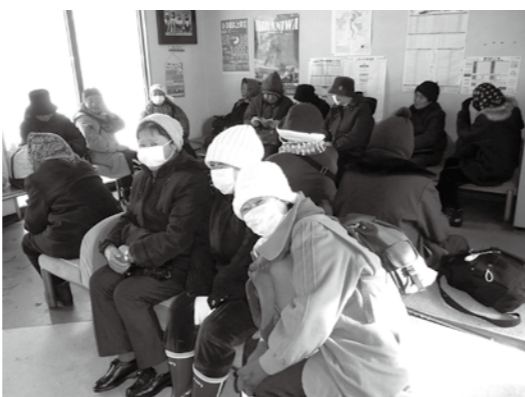
通院帰りのみなさんで混雑するJRバス葛巻駅待合室