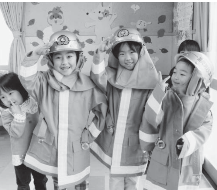
消防防火衣を着て、にこにこ顔の小屋瀬保育園児ら