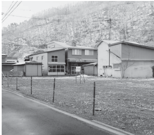
空き家が約40戸に増加した町中心部の新町地区

町長 25年度国保会計の状況は、国保税額が加入者の減少や低所得者の増加から当初見込みより500万円ほど減額になります。歳出では医療費の大幅な伸びから、5400万円の補正が必要となりました。財政調整基金も枯渇状態です。 財源不足となった場合は、国保税の税率の見直しにより財源確保すべきものですが、消費税増税などを考慮し、26年度は一般会計から1億3300万円を繰り出して、国保財政運営に努めます。 一般的に加入者数が、3000人未満の小規模保険者の財政運営は厳しいと言われていきます。国では、29年度までに市町村国保を都道府県に移行できる体制づくりを進めており、この動向を注視しながら、国保制度の安定的な運営を図ります。