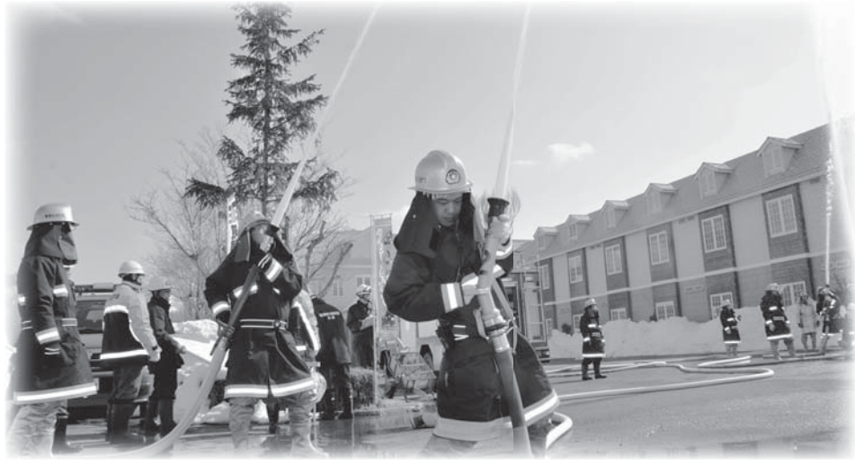
グリーンテージで行われた火災防衛訓練

3月定例会議で、条例の一部改正などの審議が行われ、すべて全議員の賛成で原案どおり『決定』しました。 主な内容は次のとおりです。