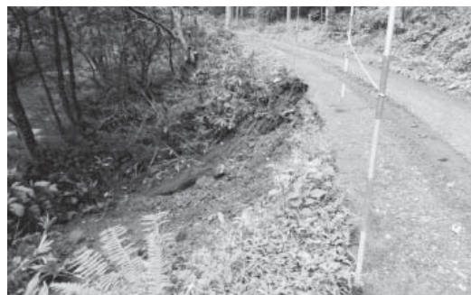
台風18号の大雨で路肩が崩壊した町道上外川線

地域の元気臨時交付金1億7170万円を、26年度事業の総合運動公園改修工事の財源に充てるため、公共施設等整備基金に積み立てました。 各会計の補正額と主な予算の使いみちは上の表のとおりです。