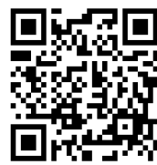
申込 QR コード