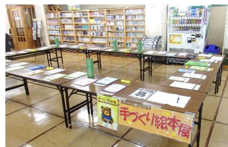
昨年度の手づくり絵本展

令和3年度の手づくり絵本展に応募された全63点を 展示します。入賞作品や本町から応募した22作品も展 示しますので、この機会にぜひ、手に取ってご覧ください。