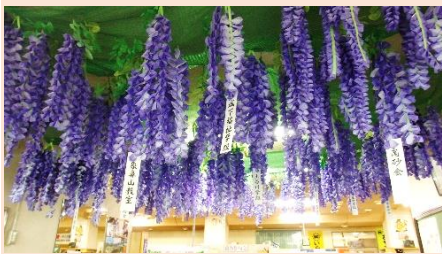
▲葛巻福祉大学「藤の花」