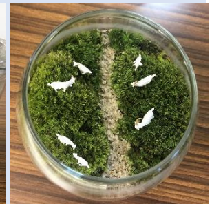
▲小瓶の中の小さな世界を苔で表現

24日にはくずまき町民まつりに併せ、ハロウィンパーティーを開催！仮装をした子どもたちが新町～総合センターをパレードします。お楽しみに！