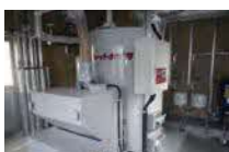
⑫ペレットボイラー(H21) 10万kcal @マイホームくずまき