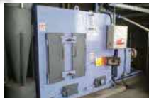
⑧ペレットボイラー (S63, H27) 25万kcal @森の館ウッティ