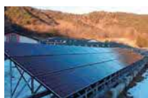
⑮太陽光発電設備(H25) 10kW 蓄電池:15kWh @小屋瀬中学校