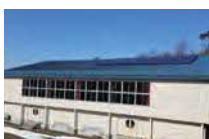
⑬太陽光発電設備(H26) 10kW 蓄電池:15kWh @旧吉ヶ沢小学校