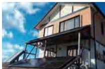
⑦ゼロエネルギー住宅(H19) 地中熱ヒートポンプ:10.5kW 太陽光発電:3.36kW 太陽熱温水器:2.87㎡ @くずまき高原牧場