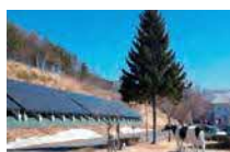
⑭太陽光発電設備(H25) 100kW 蓄電池:15kWh @グリーンテージくずまき