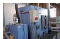
㉒ペレットボイラー(H29) 49.9万kcal @江刈小学校