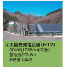
④太陽光発電設備(H12) 50kW(126W×420枚) 蓄電池:20kWh @葛巻中学校