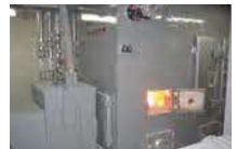
⑪ペレットボイラー(H15) 50万kcal×2基 @アットホームくずまき