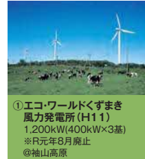
①エコワールドくずまき 風力発電所(H11) 1,200kW(400kW×3基) ※R元年8月廃止 @袖山高原