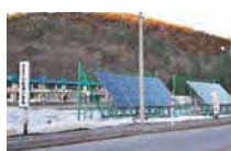
⑳太陽光発電設備(H27) 10kW 蓄電池:15kWh @小屋瀬小学校