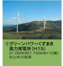
②グリーンパワーくずまき 風力発電所(H15) 21,000kW(1,750kW×12基) @上外川高原