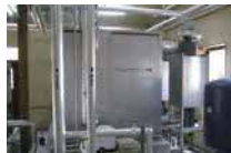
⑨ペレットボイラー(H20) 43,000kcal×2基 @森の館ウッティ