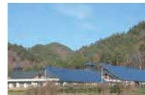
⑩太陽光発電設備(H15) 20kW @アットホームくずまき