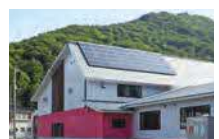
⑰太陽光発電設備(H25) 10kW 蓄電池:15kWh @葛巻小学校