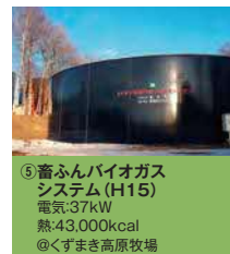
⑤畜ふんバイオガス システム(H15) 電気:37kW 熱:43,000kcal @くずまき高原牧場