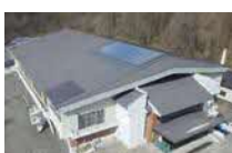
⑱太陽光発電設備(H27) 15kW 蓄電池:15kWh @社会体育館