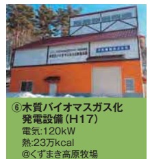
⑥木質バイオマスガス化 発電設備(H17) 電気:120kW 熱:23万kcal @くずまき高原牧場