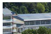
⑯太陽光発電設備(H25) 10kW 蓄電池:15kWh @五日市小学校