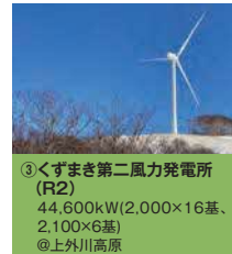
③くずまき第二風力発電所 (R2) 44,600kW(2,000×16基、 2,100×6基) @上外川高原