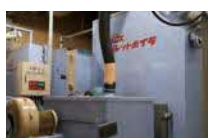
㉑ペレットボイラー(H29) 35万kcal×2基 @葛巻病院