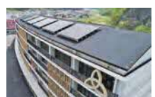
㉓太陽光発電設備(R4) 86.4kW 蓄電池:16.2kWh @葛巻町役場(くずまーる)

葛巻町役場 農林環境エネルギー課 〒028-5495 岩手県岩手郡葛巻町葛巻第16地割1-1