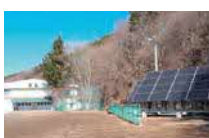
⑲太陽光発電設備(H27) 10kW 蓄電池:15kWh @江刈中学校