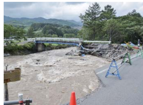
▲昨年8月の台風10号で被害を受けた道路や河川、橋、農業施設などの早期復旧に努めます（写真は町道本木遠矢場線の崩落現場）