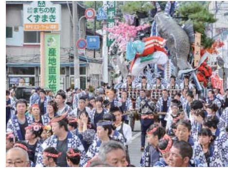
▲豪華絢爛な4台の山車と郷土芸能が練り歩く「くずまき秋まつり」には毎年、町内外から大勢の観衆が詰めかけます。秋まつりを観光資源として広く誘客を図ります