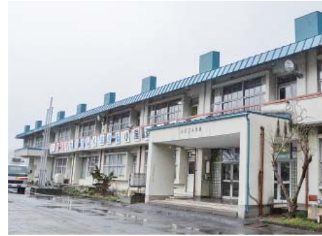
▲昭和47年に建設され、老朽化が著しい小屋瀬小学校の校舎。快適性の向上に向け、各教室の断熱工事などを実施します