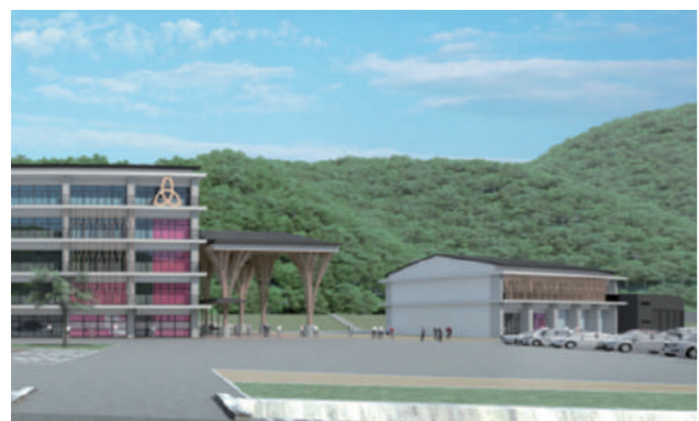
消防分署棟と車庫棟の完成イメージ