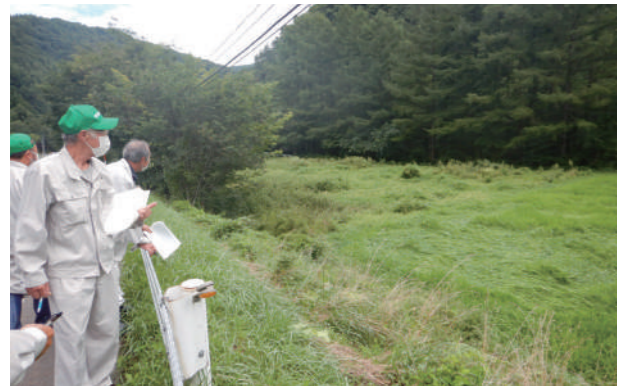
昨年の農地パトロールの様子