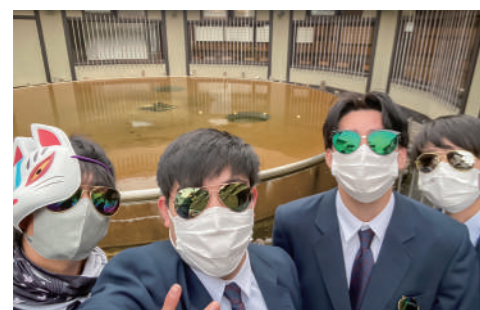
おそろいのサングラスも楽しい思い出に

に再建され、世界最大規模の木造建築物として威容を誇っています。主なご利益は「無病息災」なのでこのご時世にピッタリなパワースポットですね。 先生方や保護者の方々のおかげで、楽しく充実した修学旅行になりました。感謝の気持ちを忘れずに、これからも学校生活を送りたいと思います。