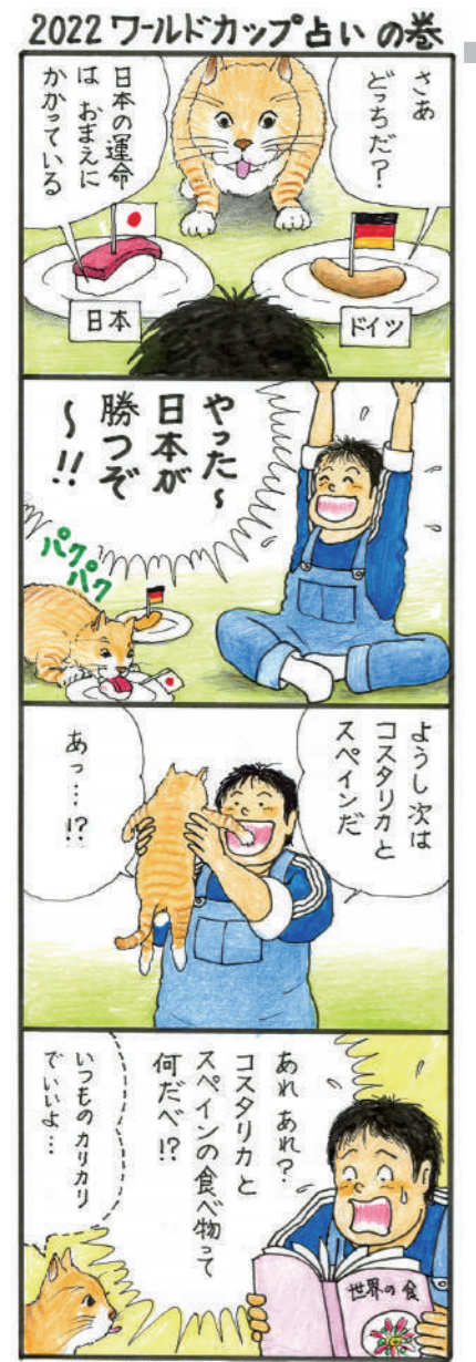
※ドイツ戦後 描いたものです