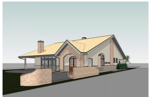
「道の駅レストラン」完成イメージ