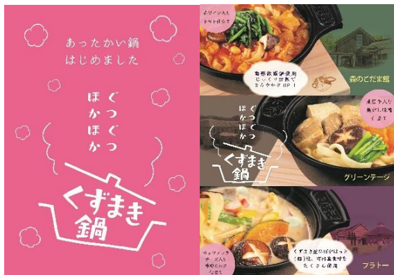
昨年度販売された「くずまき鍋」