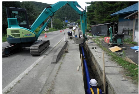
安心・安全な水の供給ための計画的な整備