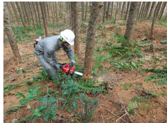
町の基幹産業である林業