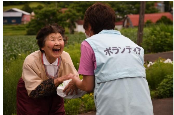
笑顔も届ける配食サービス