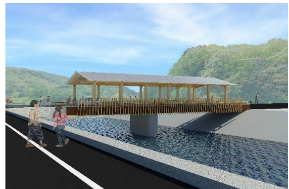
「新大橋」完成イメージ