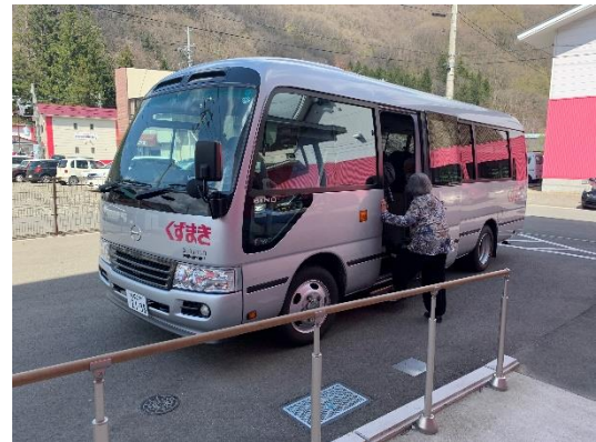
葛巻病院への送迎バス