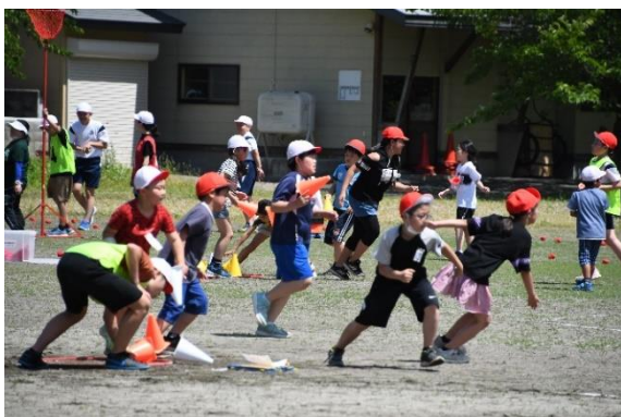
元気に遊ぶ子どもたち