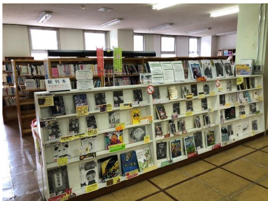
現在の公民館図書室