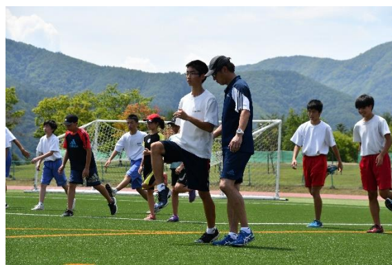
合宿中の明治大学陸上部による陸上教室