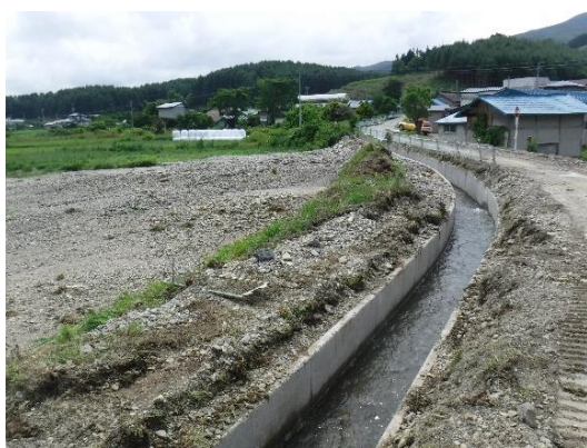
豪雨災害を受けた大平沢川河川下流