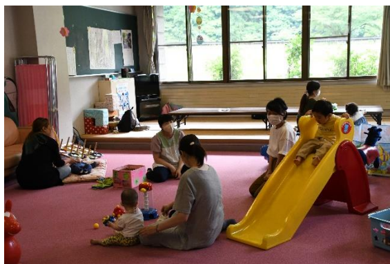
子育てサロンに参加する親子