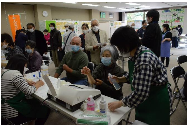
健康づくりへの取組み