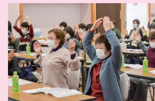
シルバーリハビリ体操を体験する委員

保健委員は、健診の運営や健康づくりの啓発活動など、令和4年度も活発な活動を行います。