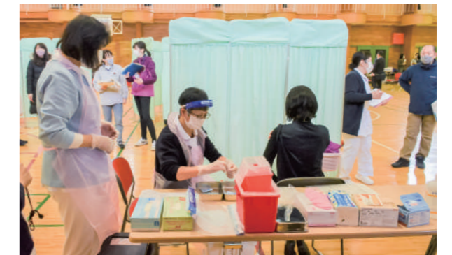
集団接種の会場は葛巻小学校体育館です

記載の日付より1か月前から接種が可能になりました。(この例では、2月1日から可能)