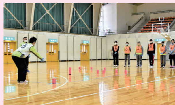
相手陣地のクップを狙う選手

第37回町民総合体育大会後期競技（1月16日開催）では、新種目「クップ」を行います。