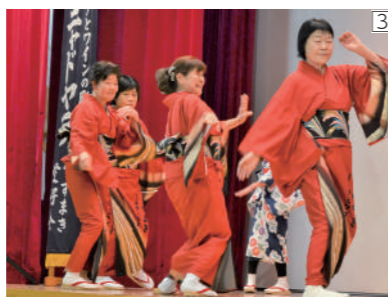
①車門念仏剣舞保存会②葛巻みんなの伝承会③ナニヤドヤラ葛巻愛好会④葛巻神楽保存会⑤小屋瀬さんさ踊り保存会