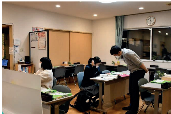
公営学習塾での指導の様子