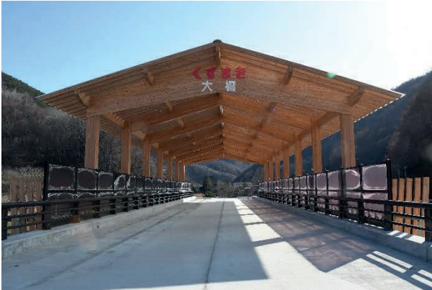
町道葛巻浦子内線の顔となる「大橋」