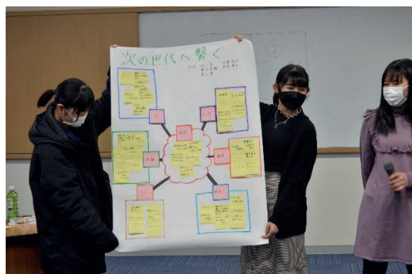
DMO事業での高校生の発表