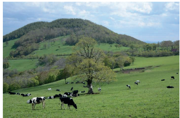
袖山高原に放牧中の乳牛