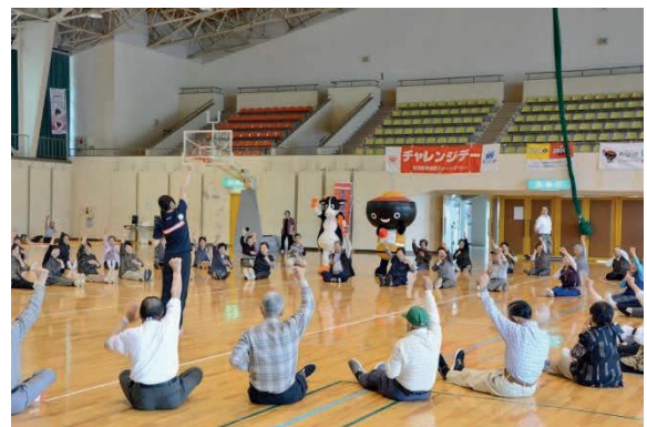
指導を受けながら運動する高齢者の方々