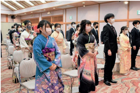
晴着姿の新成人たち