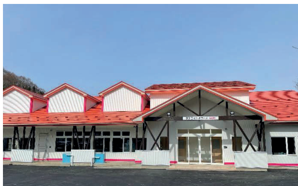
サテライトオフィスくずまき

国が推進するデジタルトランスフォーメーション（DX）の実現に向け、「サテライトオフィスくずまき」を町内外の企業や個人事業主向けのリモートワークの場とするほか、パソコン活用に係る生涯学習教室の開催等により、施設の利用拡大を通じて、町内外からの人の流れを生み出し、関係人口の拡大を図ります。