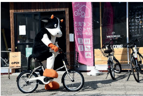
町ではレンタサイクルも行っていきます