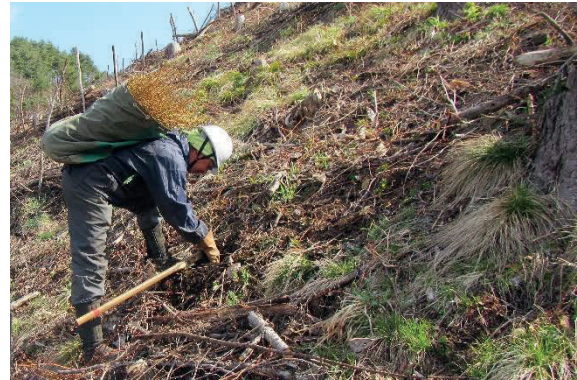
再造林に向けた植栽作業

町の基幹産業である林業において、作業・流通に関連して主となる林道の整備を行い、作業性の向上及び通行の安全性、利便性の向上を図ります。