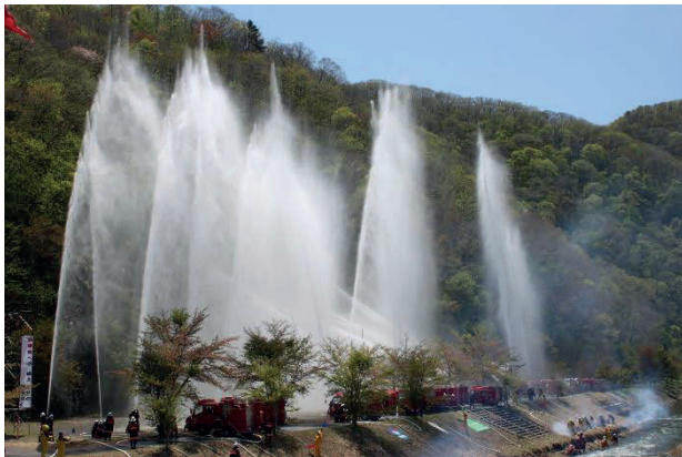
消防演習での放水訓練

災害の多発化などにより、消防団員の役割が大きくなっている一方で、消防団員数が減少していることから、消防団員の年額報酬や火災・災害等へ出動した際の出動報酬を増額することにより消防団員の処遇改善を図り、消防団員の士気向上と、団員の安定確保に努めます。