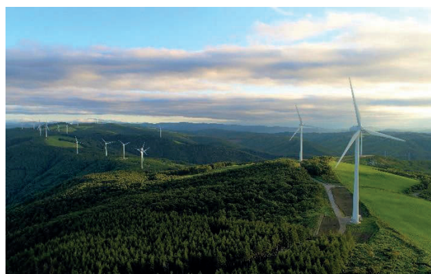
上外川高原風力発電所