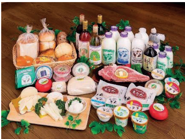
町の特産品の販売を支援します