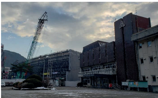
建設が進む新庁舎と現庁舎

各種施設を集約化及び複合化した役場庁舎への建替えに係る建設工事を進めます。令和4年度は施工監理業務（1期+2期）、機器等移設業務、1期工事分（精算分）、2期工事分（前金払）、付帯工事（新庁舎内設備関係）及び新庁舎用備品の購入を計画しています。