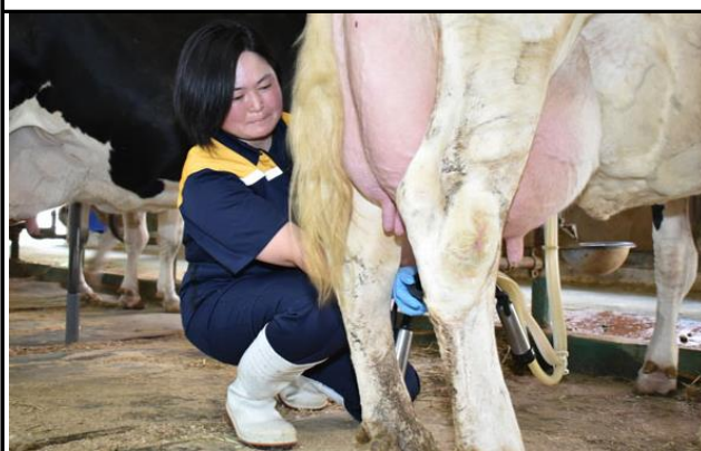
1日2回の搾乳作業。新鮮なミルクを全国に届ける仕事です。