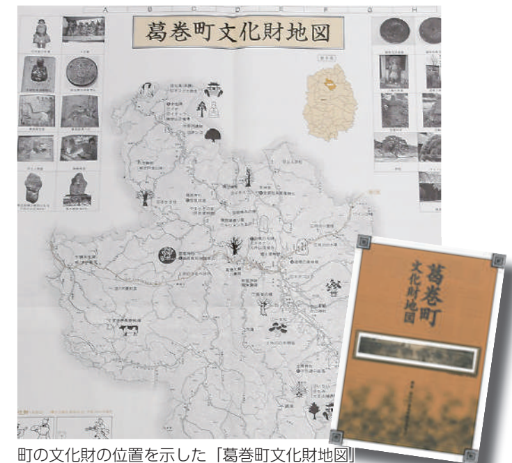
町の文化財の位置を示した「葛巻町文化財地図」