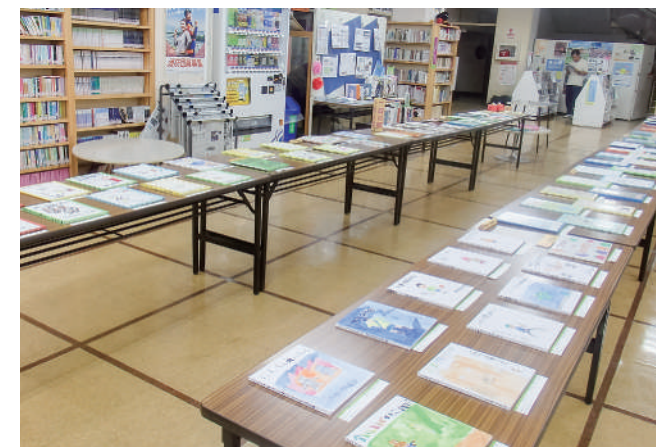
個性豊かな本が並んだ昨年の「手づくり絵本展」の様子