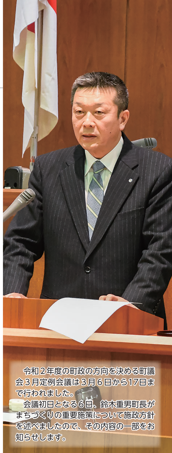
令和2年度の町政の方向を決める町議会3月定例会議は3月6日から17日まで行われました。会議初日となる6日、鈴木重男町長がまちづくりの重要施策について施政方針を述べましたので、その内容の一部をお知らせします。