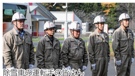
除雪車の運転手の皆さん