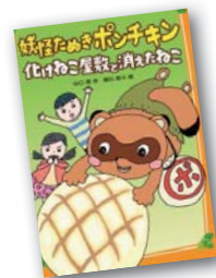
『妖怪たぬきポンチキン』 山口 理作 作

出会うはずのなかった4つの日常が、突然踏み込んできた暴漢と森の中を逃げ惑う姉妹によってつなげられていく。つながるはずのない縁がつながった時、最悪の事態は避けられないところまで来ていた…。