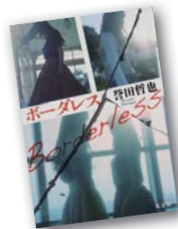
『ボーダレス』 菅田 哲也 作

この機会に、スポーツで心地よい汗を流し、健康・体力づくりに取り組んでみませんか。スポーツ施設の利用に関することは町スポーツ協会(施設指定管理者)にお問い合わせください。 閩町スポーツ協会 ☎66-3607