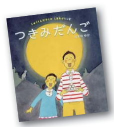
『つきみだんご』 はまの ゆか 作

「人間を幸せにする」という修業のため、人間界にやってきた妖怪たぬきのポンチキン。ある日、とつぜん町中のねこが消えてしまいます。「化けねこ屋敷」に猫が吸い込まれていくという噂を聞いたポンチキンは…。