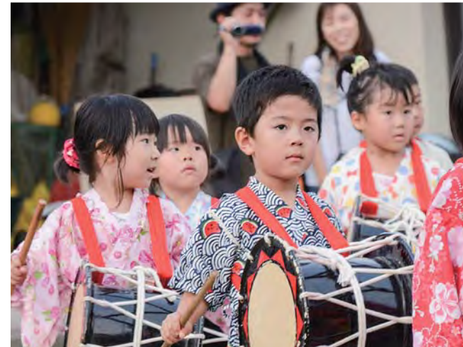
真剣な顔で盆踊りの太鼓たたきをする園児