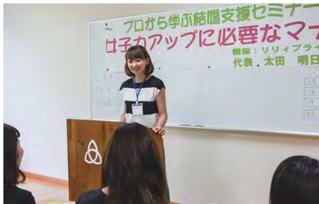
女子力アップに必要なマナーを学ぶ参加者の皆さん

始めに男女に分かれて「プロから学ぶ結婚支援セミナー」を受講。性別による感じ方や考え方の違いや会話の引き出し方など、コツを学んだ参加者たちは、早速実践しながらにぎやかに交流を深めていました。