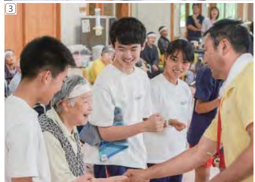
①真剣に授業に取り組む姿を後輩に見せる生徒たち(7月3日、中学生体験入学)②葛巻町学習塾で学びを深める塾生③葛葉荘の利用者とレクリエーションを楽しむ生徒たち(7月20日、中高連携奉仕作業)