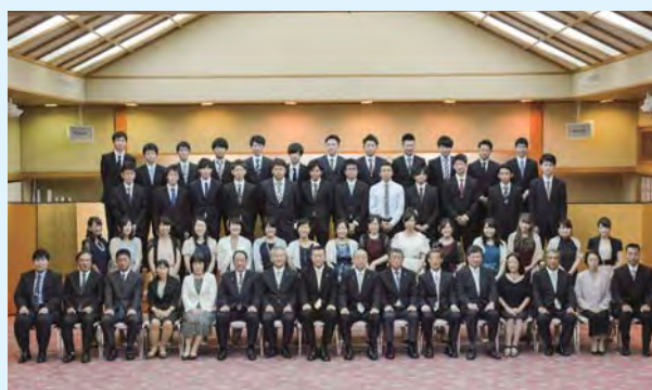
昨年の成人式典での記念撮影の様子