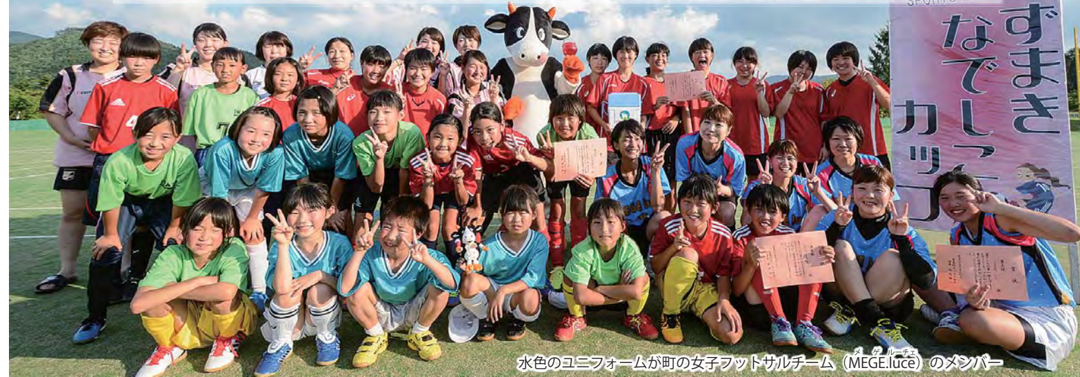
水色のユニフォームが町女子フットサルチーム(MEGE.luce)のメンバー

この大会は、平成27年から活動している町的女子フットサルチーム(MEGE.luce)のメンバーたちから「女子のフットサル大会を地元で開催したい」との熱い要望を受けて、町サッカー協会が主催したもの。勢いに乗った、なでしこたちのさらなる活躍に期待が膨らみます。