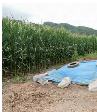
農地に設置された電気柵