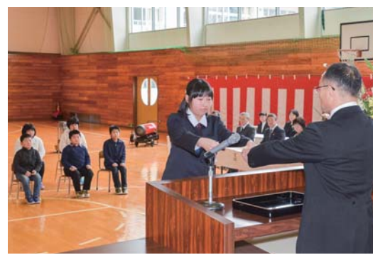
吉ヶ沢小学校の卒業式。地域の要望に沿い、平成31年4月の小屋瀬小学校への統合に向けて進めていきます。

スポーツは、個々の健康増進と体力向上を通じて日常生活に潤いや活力を与えただけではなく、人と人あるいは地域と地域の交流を促進し、地域の一体感を醸成するものであり、地域コミュニティの再生に大きく寄与するものです。町民だれもが、それぞれの関心や適性に応じて、安全な環境のもとでスポーツやレクリエーションに取り組むことができるよう、日