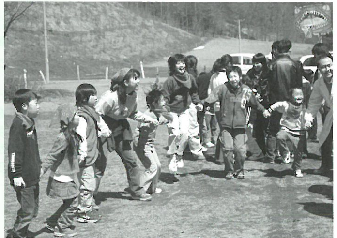
班に分かれ、ゲームを楽しむ子どもたち

ワークショップは、11月までの第2土曜日に開かれ、子どもたちは町内中学生を含む大学生ら23人の運営スタッフとともに、自然の中で思いっきり遊びを満喫します。天候に恵まれたこの日は、町内外の小学生29人が参加しました。ここでの自分の呼び名を決め、自己紹介を終えると、3班に分かれてゲームや鬼ごっこなどで楽しみました。