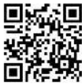
申込み QR コード