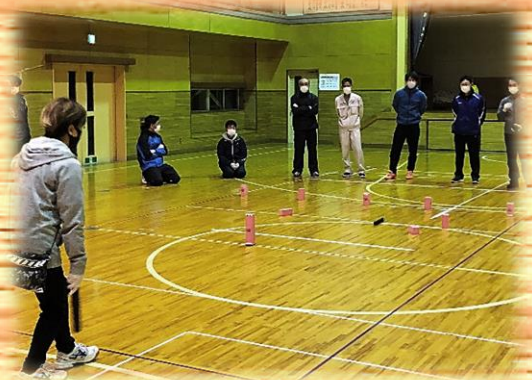
北部地区体育振興会でのクubb体験

また、12月上旬からくずまきテレビでクubbの番組を放送します。プレーの進め方やゲームの流れを紹介しますのでぜひご覧ください。