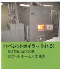
⑪ ペレットボイラー (H15) 50万kcal×2基 ◎アットホームくすまき