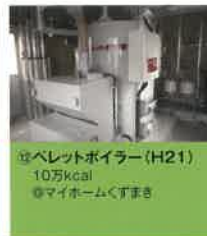
⑫ ペレットボイラー (H21) 10万kcal ◎マイホームくすまき