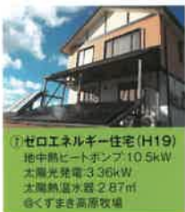
⑦ ゼロエネルギー住宅 (H19) 16中熱ヒートポンプ:10.5kW 太陽光発電:3.36kW 太陽熱温水器:2.87㎡ ◎くすまき高原牧場