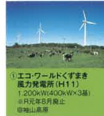
① エコワールドくすまき 風力発電所 (H11) 1,200kW(400kW×3基) ※元年8月廃止 ◎袖山高原