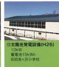
⑬ 太陽光発電設備 (H26) 10kW 蓄電池:15kWh ◎旧吉ヶ沢小学校