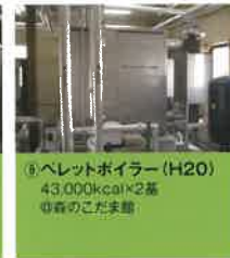
⑨ ペレットボイラー (H20) 43,000kcal×2基 ◎森の館ウッディ