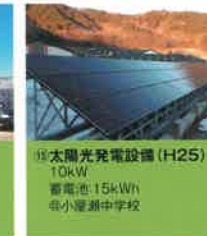
⑮ 太陽光発電設備 (H25) 10kW 蓄電池:15kWh ◎小塚瀬中学校