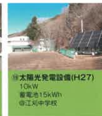
⑲ 太陽光発電設備 (H27) 10kW 蓄電池:15kWh ◎江刈中学校