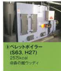
⑧ ペレットボイラー (S63, H27) 25万kcal ◎森の館ウッディ