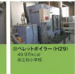
㉒ ペレットボイラー (H29) 49.9万kcal ◎江刈小学校

葛巻町役場 農林環境エネルギー課 〒028-5495 岩手県岩手郡葛巻町葛巻第16地割1-1