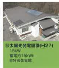
⑱ 太陽光発電設備 (H27) 15kW 蓄電池:15kWh ◎社団法人葛巻町