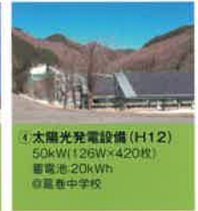
④ 太陽光発電設備 (H12) 50kW(126W×420枚) 蓄電池:20kWh ◎葛巻中学校