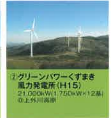
② グリーンパワーくすまき 風力発電所 (H15) 21,000kW(1,750kW×12基) ◎上外川高原