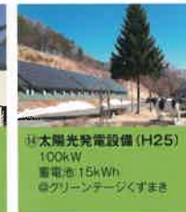
⑭ 太陽光発電設備 (H25) 100kW 蓄電池:15kWh ◎グリーンテージくすまき