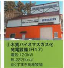
⑥ 木質バイオマスガス化 発電設備 (H17) 電気:120kW 熱:23万kcal ◎くすまき高原牧場