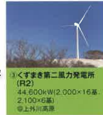
③ くすまき第二風力発電所 (R2) 44,600kW(2,000×16基・ 2,100×6基) ◎上外川高原