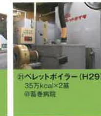
㉑ ペレットボイラー (H29) 35万kcal×2基 ◎葛巻病院