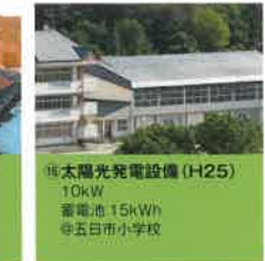
⑯ 太陽光発電設備 (H25) 10kW 蓄電池:15kWh ◎五日市小学校