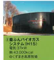
⑤ 畜ふんバイオガス システム (H15) 電気:37kW 熱:43,000kcal ◎くすまき高原牧場