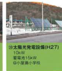
⑳ 太陽光発電設備 (H27) 10kW 蓄電池:15kWh ◎小塚瀬小学校