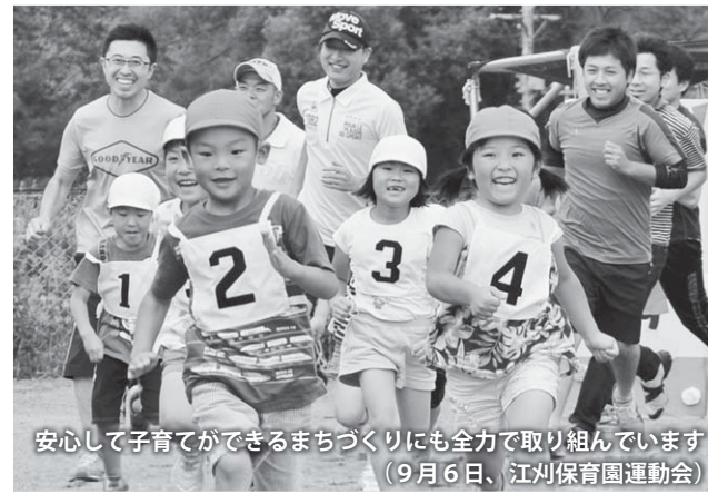
安心して子育てができるまちづくりにも全力で取り組んでいます（9月6日、江刈保育園運動会）

一般会計と特別会計を合わせた決算総額は86億8520万円となり、前年度を2042万円（0.2%）下回ったものの、ほぼ同水準の決算額となりました。