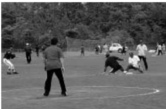
心地よい汗を流した390歳ソフトボール競技とファミリーバレーボール競技