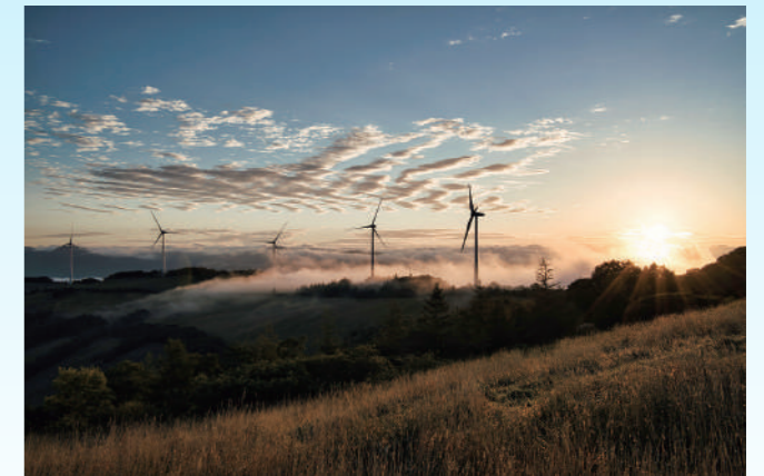
くずまきフォトキャンペーン 最優秀賞 江田智哉さん(元木)