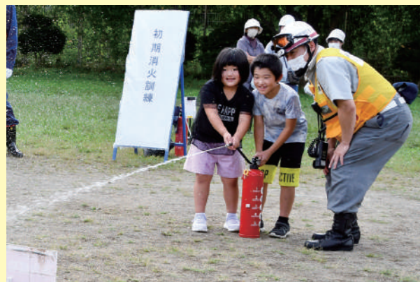
初期消火訓練に参加する子どもたち（令和5年9月10日、町総合防災訓練）