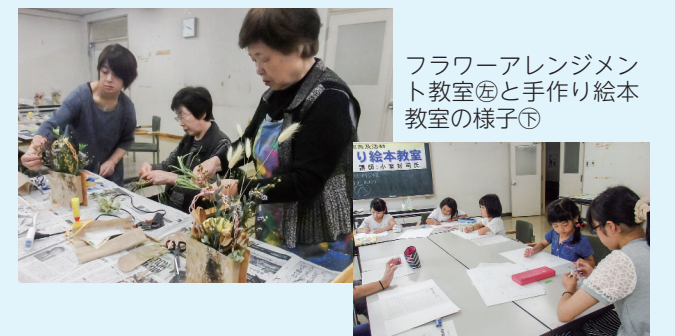
フラワーアレンジメント教室⑤と手作り絵本教室の様子⑥

なお、使用料が免除される団体など詳しくは、公民館 ☎66-2111内線163へ気軽にお問い合わせください。