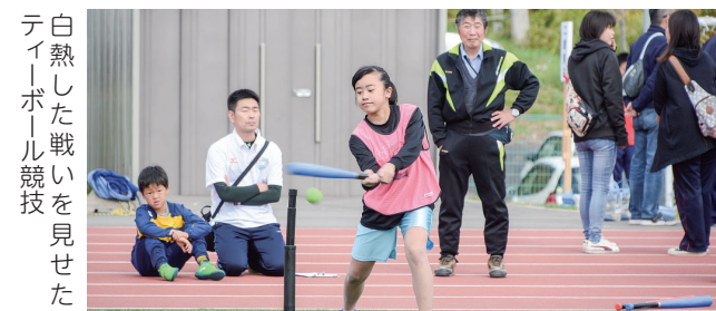
白熱した戦いを見せたティーボール競技