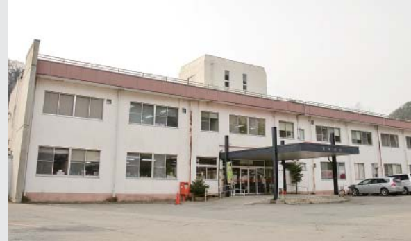
〔5〕平成29年9月1日・広報くずまき

平成29年 44年間の役割を終えた旧葛巻病院。 【病床数78床(一般60、療養18)】