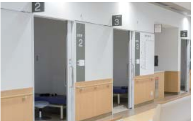
③ 1階 外来