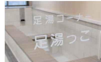
① 1階 足湯コーナー (足湯っこ)