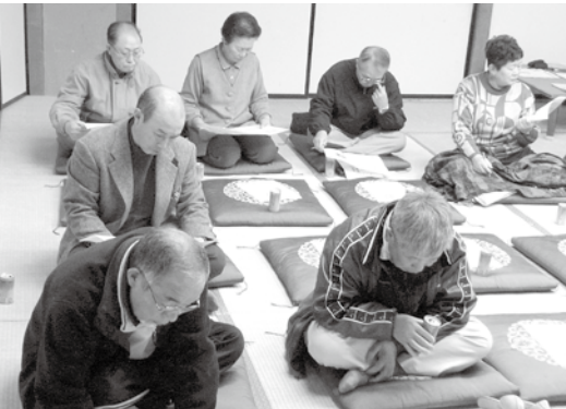
中部会場（総合センター）

議会に寄せられた意見に対する答えとして、開催を継続し、自由に話し合える環境を作ります。今後の開催については、テーマを持ちたり、組織や団体にも別途開催をお願いしたり、自治会単位など参加範囲を狭くして、開催時期についても年中を通して要望に応じて開催する方針です。