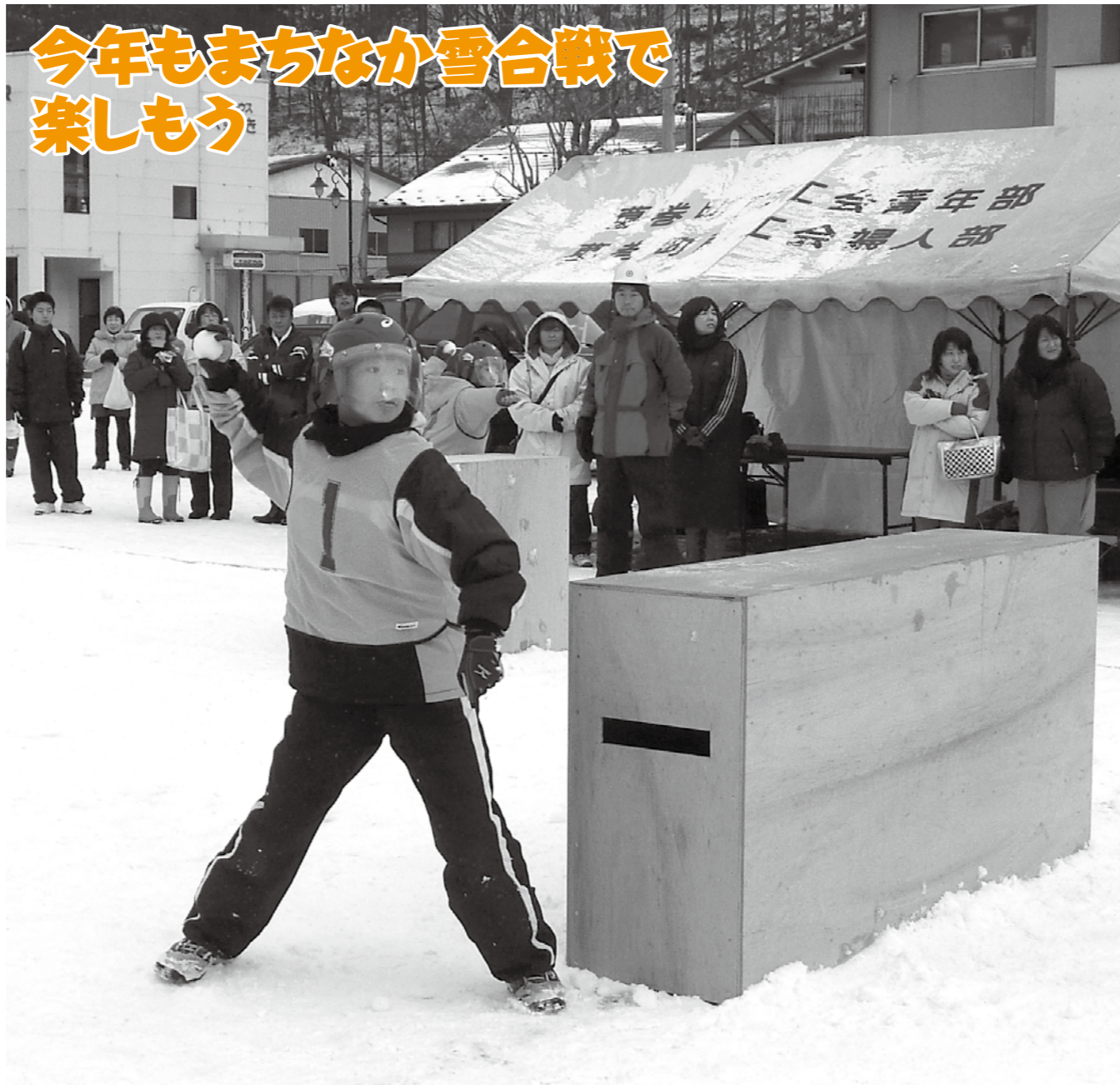
昨年1月15日のまちなか雪合戦大会。今年も1月31日(日)にJRバス葛巻駅構内で開催されます