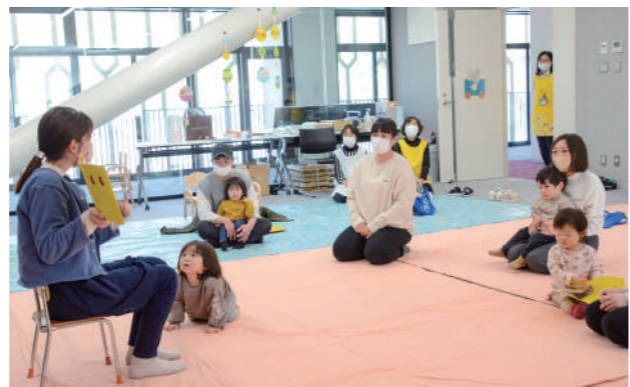
令和5年度は多様な子育て支援を展開